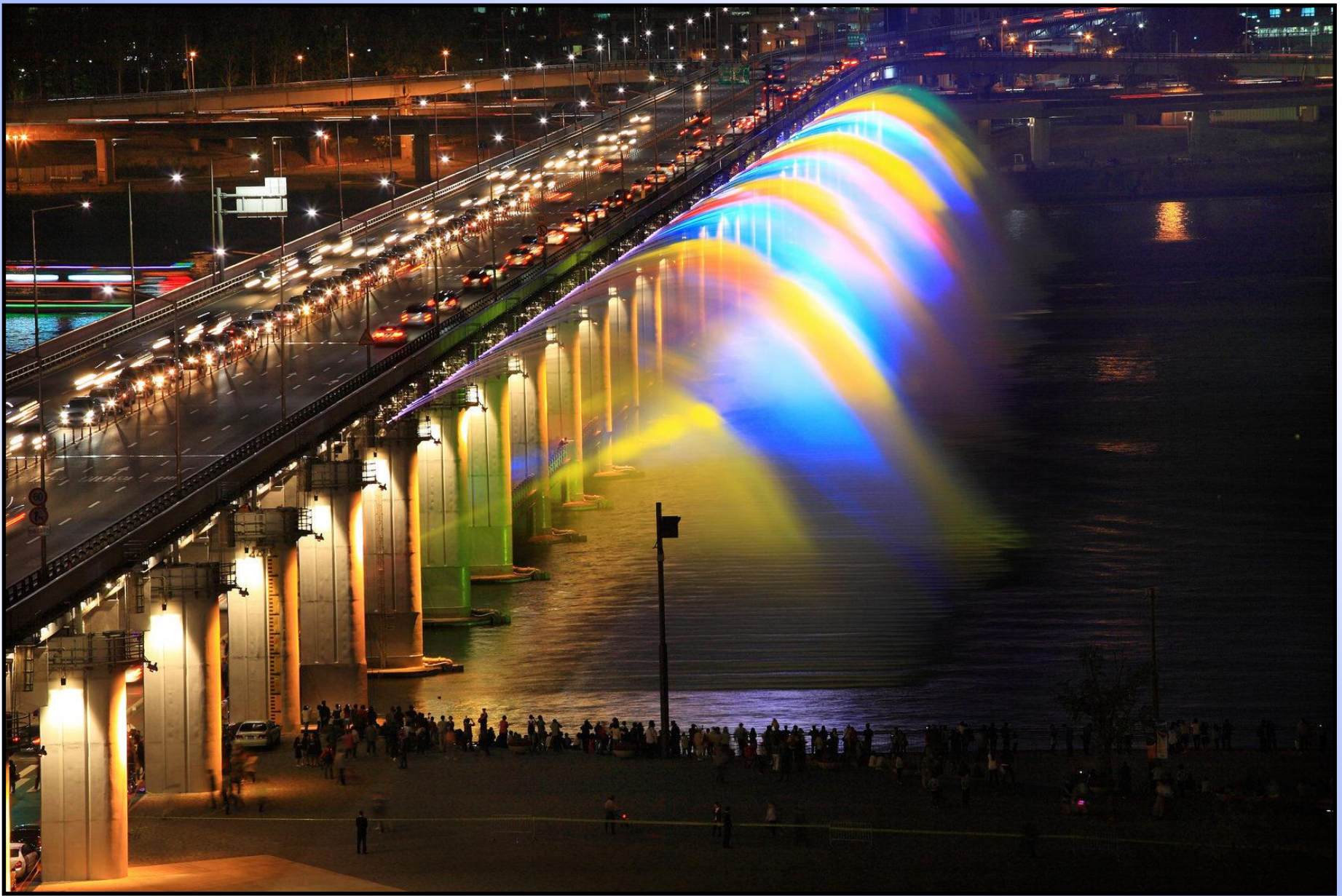
Фонтан «Лунная радуга» занесён в «Книгу рекордов Гиннеса» как самый длинный в мире