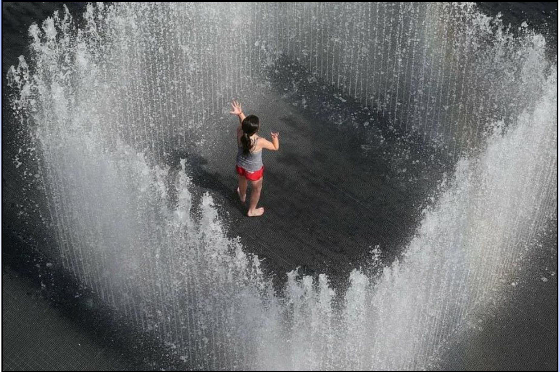
Девушка в ловушке внутри фонтана