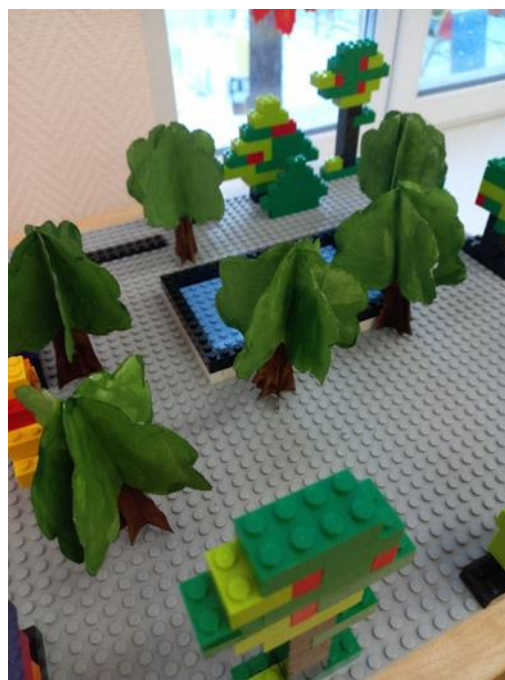
Расставили деревья в уже готовый парк.